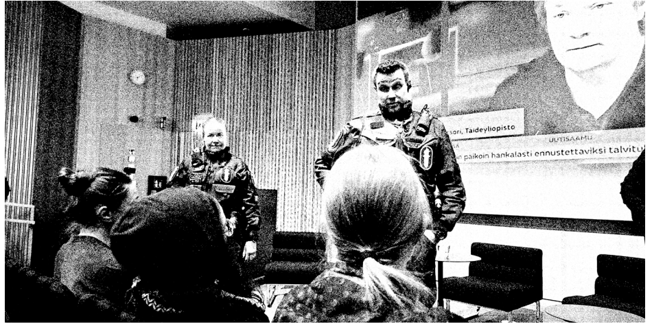
Poliisi oli vahvasti läsnä Keskisarjan luennolla.

Luennossaan Keskisarja ohitti myös kysymyksen siitä, kuinka selittää toisilleen vieraiden ryhmien ystävällinen ja toisinaan jopa epäitsekäs vuorovaikutus tai anti-rasismi. Vaikka erilaisten ihmisryhmien rinnakkaiselo ja 'toisen' rauhanomainen kohtaaminen eivät olekaan antaneet aineksia sankaritarinoihin tai edes ylittäneet historian uutiskynnystä, on niistä kuitenkin jäänyt runsaasti jälkiä: laajalti levinneitä tarinoita ja uskomuksia, kielestä toiseen lainattuja sanoja, kulttuurista toiseen kulkeutuneita tapoja, taitoja ja tietoja. Tällaisia jälkiä ei yleensä huomata tai haluta tulkita osoitukseksi ihmisten yhteenkuuluvuudesta. Mieluummin haetaan todisteita hylkimisestä, vihanpidosta ja taistelusta.