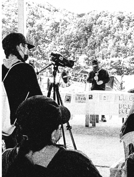
Zapatistitoverit, LOS TERCIOS COMPAS -ryhmän jäsenet kertomassa toiminnastaan.