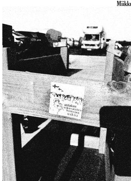
Viime kesän Suviseurakentällä levitettiin muun muassa seksuaalivähemmistöjen oikeuksiin liittyviä tarroja.

Tarratoimikunta sai nykyisen muotonsa viime vuonna 2025. Pienimuotoista tarratoimikuntaa Suviseuroissa on ollut aikaisemminkin, mutta isossa mittakaavassa toiminta on keskittynyt viime vuoden suviseuroihin. Tarratoimikunnan tehtävä on teettää ja jakaa Suviseuroissa esimerkiksi seksuaali- ja sukupuolivähemmistöjen oikeuksista sekä lisääntymis- ja seksuaalioikeuksista muistuttavia tarroja. Montaa meitä (tarratoimikuntalaista) motivoi toimintaan omat kokemukset vanhoillislestadiolaisessa yhteisössä. Organisoijia on ydinporukka, mutta mukana on tosi suuri joukko ihmisiä. Viime vuonna meillä oli noin 300 jakajaa ja saatiin 20 000 tarraa Suviseurakentälle jaettua. Tarratoimikunnan ympärille on muodostunut iso yhteisö.