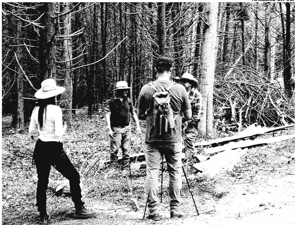
Armadillxs haastattelee Zirahuenin kunnan asukkaita Michoacánissa, Meksikossa.