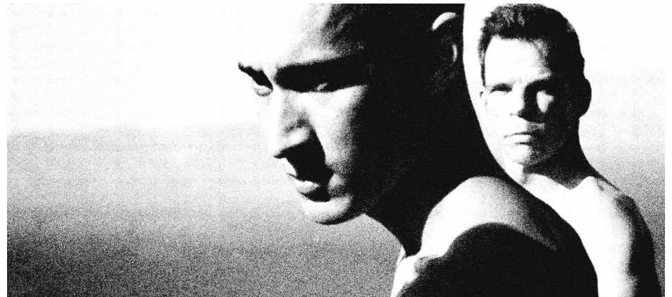
Kuvakaappaus elokuvasta Hyvää Työtä

Djiboutin karuja maisemia silmänkantamattomiin tarjoava, mereen päättävä aavikko Sahelin vyöhykkeellä on Djiboutissakin varttuneelle Denisille tuttu ympäristö, eikä kyseessä ole ohjaajan ainoa Saharan eteläpuoliseen Afrikkaan sijoittuva elokuva. Valtaosalle elokuvan Yle Arenasta katsovista tapahtumapaikka voisi kuitenkin yhtä hyvin olla Mars, joskin elokuvan maisemissa on aina asunut ihmisiä. Teoksen asetelmassa ulkopuolinen on val-